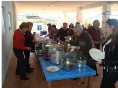
Festa da Matança do Porco 2015, na Casa do Oeste